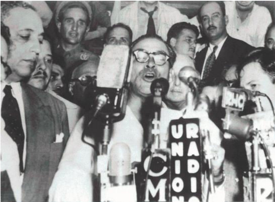
Cuba. General Fulgencio Batista, der tog magten ved et kup i 1952...