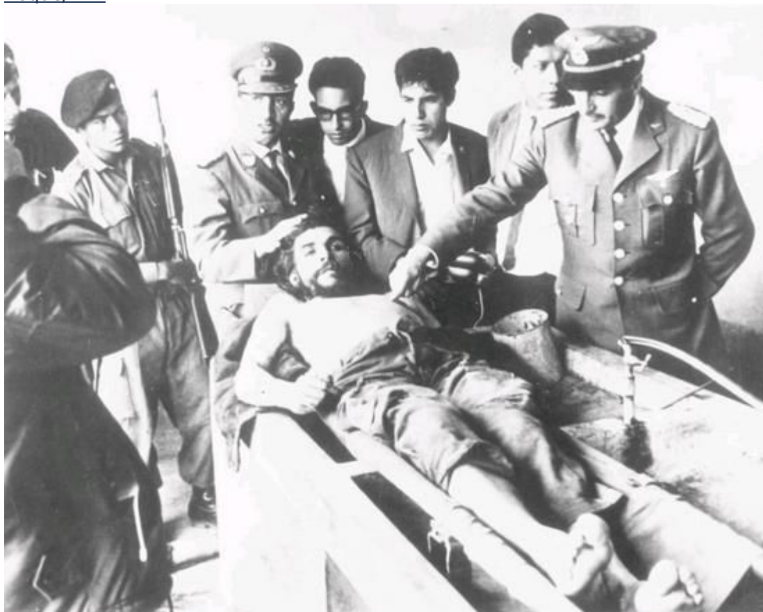
Cuba. Ligsyn over guerillakrigeren Ernesto Che Guevara.

Cuba. Den colombianske forfatter og nobelprisvinder Gabriel Garc...